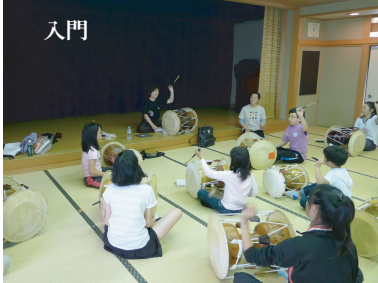
舞踊(珍島ブクチュム)